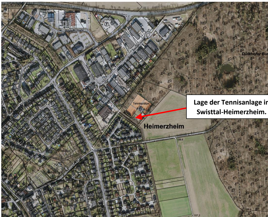
Abb.2: Lage der Tennisanlage in Swisttal-Heimerzheim, Breniger Straße 18b