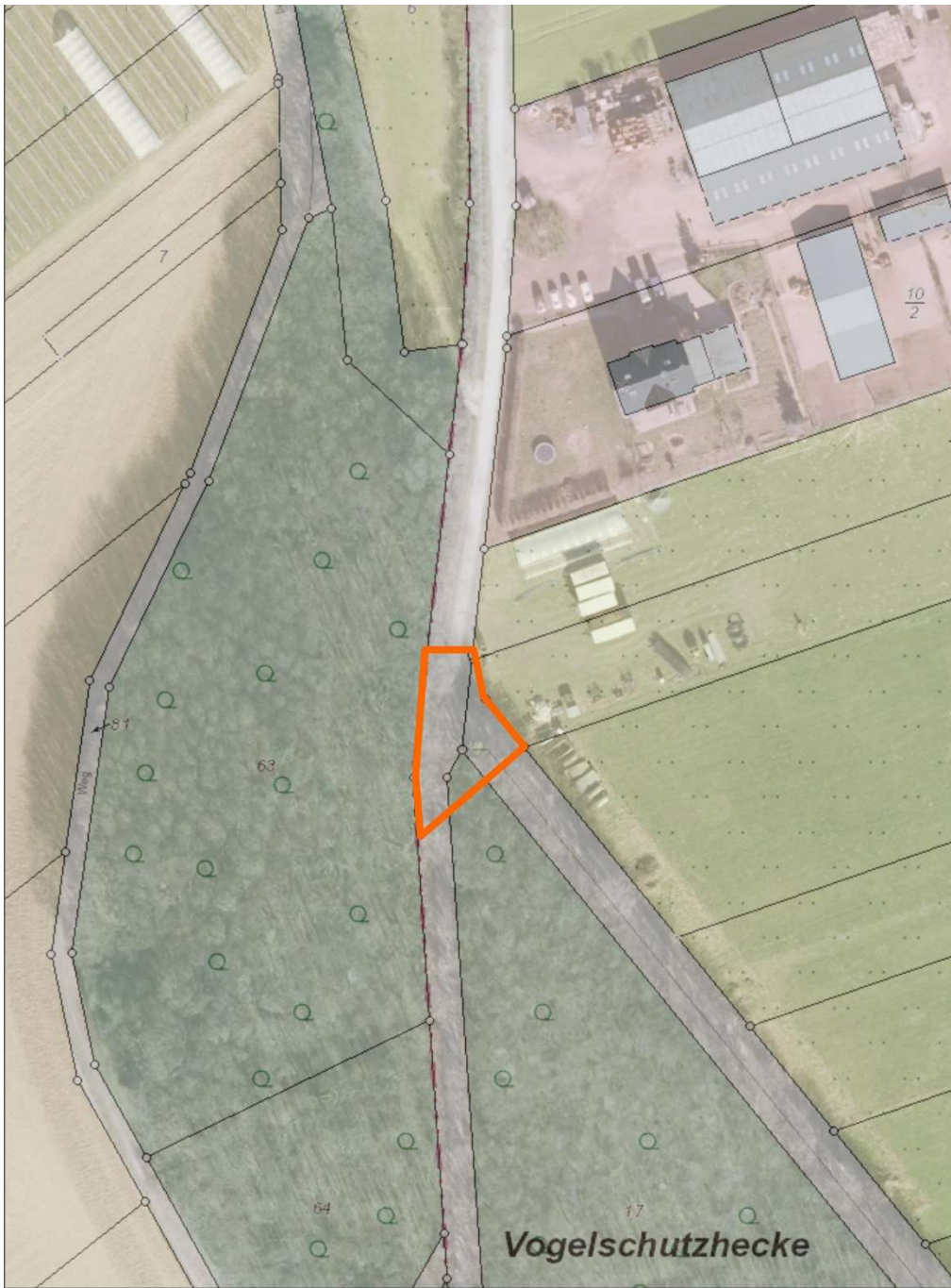
Abb.5: Lage der infizierten Eiche südlich des „Rosenhofes“ bei Buschhoven, in der Verlängerung der Dietkirchstraße