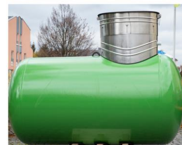
Armaturen eines Flüssiggastanks (oben), oberirdischer Tank (Mitte) und erdgedeckter Tank (unten).

Kontakt Flüssiggas-Sicherheitsdienst: 069-75 90 9-15 3