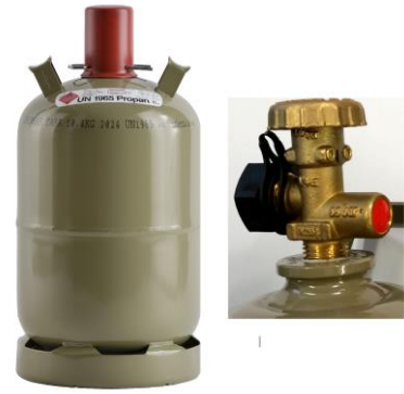
Flüssiggasflasche mit Ventilschutzkappe (links), freiliegendes Flaschenventil (rechts).